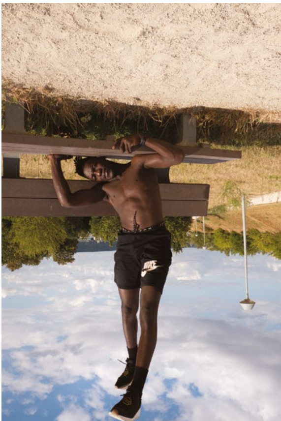
Atlas - 2020