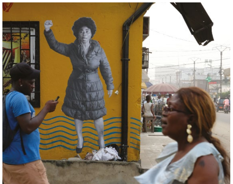
DS, 13 images présentées sur les murs du quartier New Bell de Douala pendant pour le SUD /off