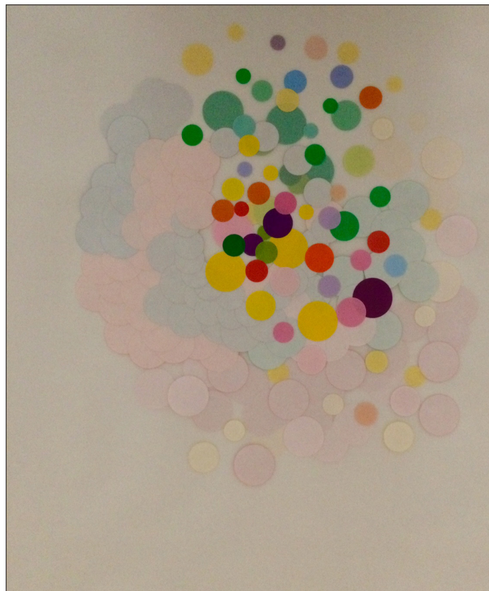
© Louise Fabre - Sans titre - collage sur papier, 42x59.4cm - 2018

Pour cette exposition aux Réservoirs de Limay, Sabine Boquier et Louise Fabre mettent en dialogue dessins et sculptures issus d'une démarche plastique convoquant la polychromie d'objets et de matériaux du quotidien collectés, les couleurs sont ainsi glanées. Cette démarche s'inscrit dans une perspective artistique invitant au « changement de valeur d'usage d'un objet », un concept né d'une pratique plastique apparue à la jonction des XXe et XXIe siècles. Alors qu'on annonçait la mort de la peinture, les artistes n'ont pas cessé d'élaborer des compositions colorées jouant notamment de matières disponibles, manufacturées et non-artistiques, pour élaborer des pratiques qu'on peut définir par « Ready-made color »* non sans référence à Duchamp. (*Antoine Perrot).