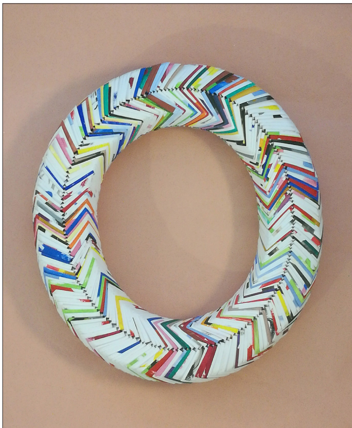
© Sabine Boquier - concordance des temps - papier, 42x49cm - 2019